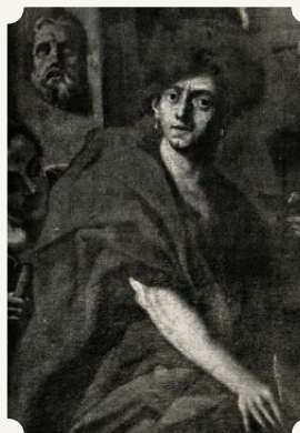
Cosmas Damian Asam: Selbstporträt mit Brüdern