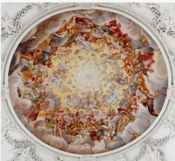
Hans Georg Asam: Deckenfresko, St. Quirinus, Tegernsee