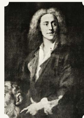
Cosmas Damian Asam: Porträt des Bruders Egid Quirin

Als ein Fleckchen „Himmel auf Erden“ gilt auch der Malerwinkel, der an die Asamstraße grenzt und tatsächlich einem rechten Winkel gleicht. Dieser liegt in der Egerner Bucht am Südufer des Tegernsees. In früheren Zeiten verewigten dort Künstler den idyllischen Ausblick auf Leinwand – so dass die Tegernseer die schöne Ecke eben kurzum „Malerwinkel“ nannten.